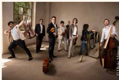
Splendor Baroque Ensemble