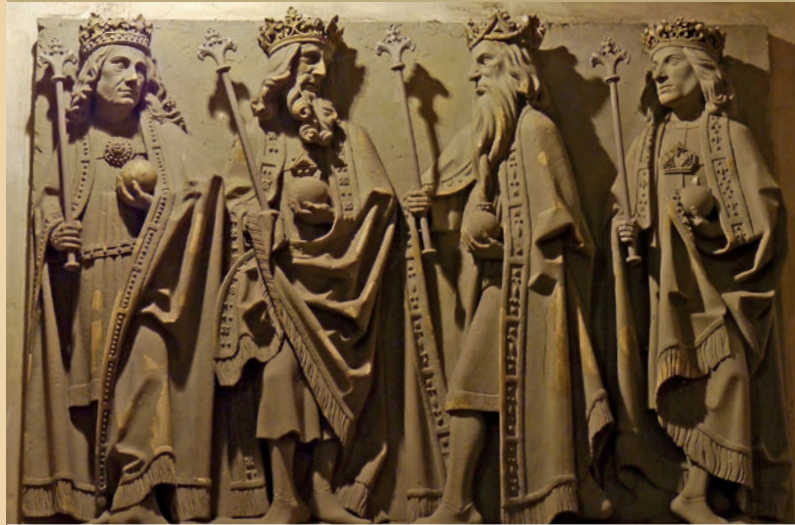
Am Ende des Lebensweges