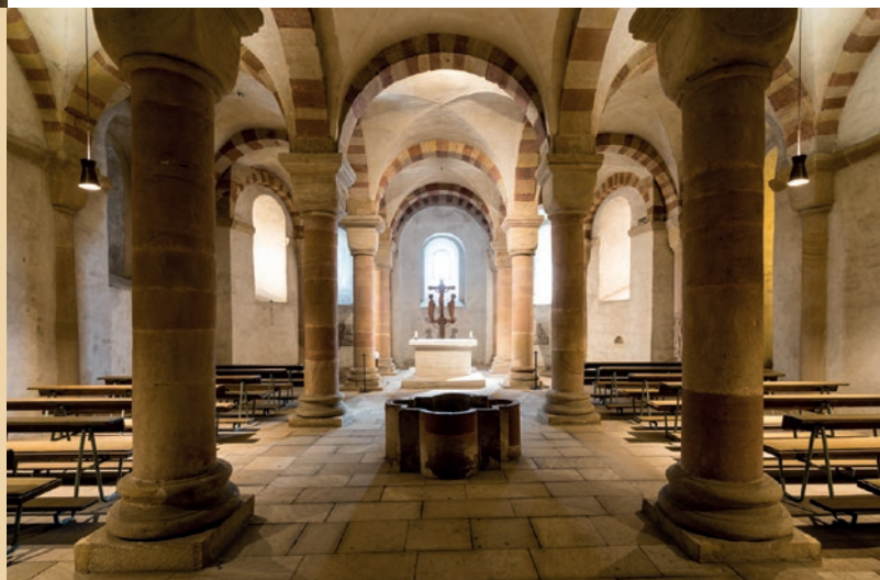
Anfang und Ende

Die Speyerer Domkrypta ist die größte romanische Hallenkrypta weltweit. Insgesamt hat sie eine Breite von 35 Metern und eine Länge von 46 Metern. Die Höhe der Gewölbe beträgt sieben Meter – für eine Unterkirche ein gewaltiges Maß.