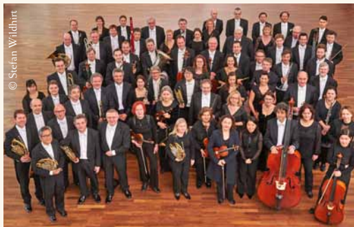
Deutsche Staatsphilharmonie Rheinland-Pfalz

Chor der Hedwigskathedrale Berlin und Domchor Speyer beim Konzert im Berliner Konzerthaus, 18.03.17