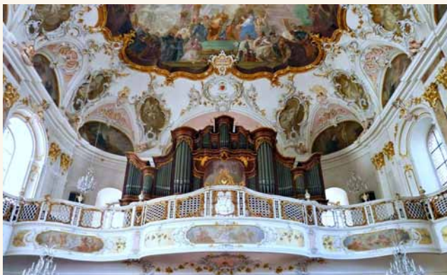
Stumm Orgel 1773, Augustinerkirche Mainz