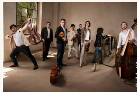
Splendor Baroque Ensemble