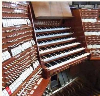
Mit seinen sechs Manualen ist der Generalspieltisch der Mainzer Domorgel einer der größten seiner Art in Europa